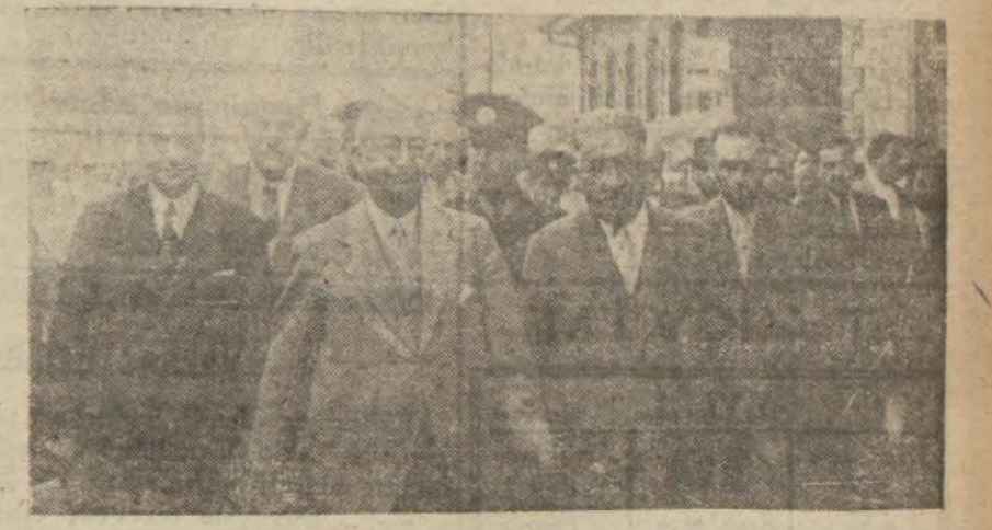
Başvekilin İzmirli ziyaretine aid bir intiba

Başvekil hareketinden evvel fuarda ecnebi devlet pavyonlarını ayrı ayrı ziyaret etti