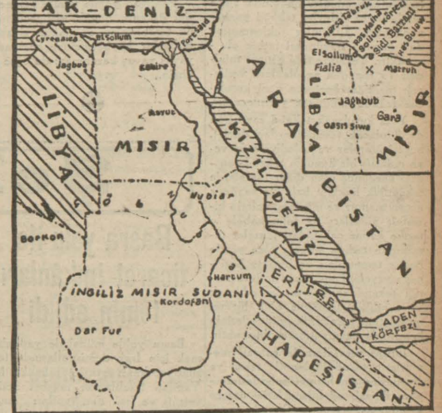
Libya - Mısır hududunu ve Mısırın diğer hududlarını gösterir harita

Londra, 18 (A.A.) — Bahriye nazırı Alexander, Amerika tarafından İngiltereye satılan destroyerlere verilecek isimleri Avam Kamarasında bildirmiştir. Alexander destroyerlerden birine Churchill'in ismi-